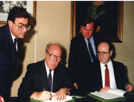
Guido de Marco, ministro de exteriores maltés (izquierda), y el comisario Abel Matutes, en la firma de la solicitud de adhesión en 1990.

Las relaciones comenzaron en 1970, cuando Malta y la Comunidad firmaron el Acuerdo de Asociación por el que se establecían relaciones bilaterales. Contempla la realización de una unión aduanera en dos fases de cinco años, pero debido a la vuelta al poder de los laboristas en junio de 1971, la segunda fase no llegó a aplicarse.