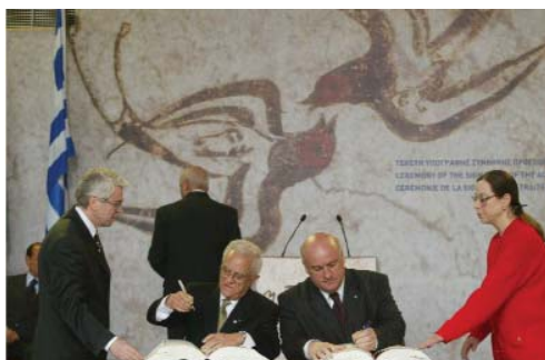
Firma del Tratado de Adhesión: Eddie Fenech Adami, primer ministro, y Joe Borg, ministro de Exteriores de Malta (16.04.2003).

Malta contará con 3 votos en el Consejo del 1 al 31 de octubre de 2004. Durante el periodo 2004-2009, el número de diputados malteses en el Parlamento Europeo será de 5 miembros.