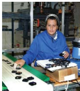
Trabajadores de productos Toly (fabricantes de cosméticos) en Bulbel Industrial Estate en Zejtun, Malta.

Buenos yacimientos de caliza y favorable situación geográfica. Malta produce el 20% de sus necesidades alimenticias, tiene limitados recursos de agua potable y carece de recursos energéticos, en consecuencia su economía depende en gran medida del comercio exterior y de los servicios.