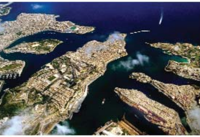
Vista aérea de los puertos de La Valletta.

El italiano también se encuentra bastante extendido entre las clases más elevadas, sobre todo en las familias de profesionales, además de ser la tercera lengua enseñada, extensamente, en las escuelas. Esta situación, junto con la popularidad de los programas de la televisión italiana, accesible a la audiencia maltesa desde hace más de una generación, ha elevado la posición del italiano después de haber sufrido una considerable merma a raíz de la Segunda Guerra Mundial.