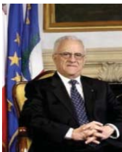
Edward Fenech Adami, actual Presidente de la República de Malta

La Cámara se encarga de seleccionar al máximo dirigente del Estado, el Presidente, con un mandato de cinco años. En la actualidad, dicho cargo es ocupado por Edward Fenech Adami (desde abril de 2004). El papel del Presidente es meramente ceremonial, si bien, tiene potestad para elegir a un miembro de la Cámara de Representantes como Primer Ministro y a otro como Líder de la oposición. Desde el 23 de marzo de 2004, Lawrence Gonzi asume las responsabilidades de Primer Ministro.