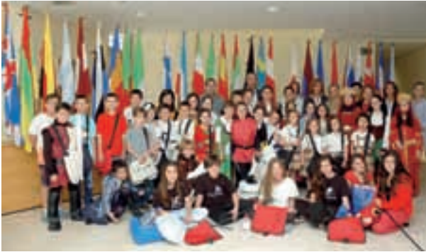
Celebración del 9 de Mayo de 2013.

Celebramos un año más el Día de Europa, y en esta ocasión con un amplio stand de material informativo sobre la UE en el hall del Teatro Principal; entre este día, 9 de mayo y el 12, hubo un gran número de actividades y eventos, y más de 1500 personas pasaron por estas instalaciones del Teatro.