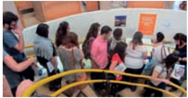
Alumnos participantes en los actos del Día de Europa

También con motivo de este día realizamos distribución de material divulgativo a los Centros de Enseñanza Secundaria de Córdoba y a otros Centros de información.