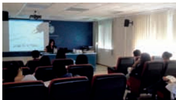
Participantes en Taller de Traducción

Actividad dirigida a las personas que buscan empleo en otro país de la UE, para darles nociones básicas para traducir su CV al inglés o alemán