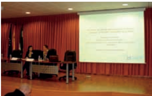
Conferencia sobre los Fondos 2014/2020

Celebrada el 27 de noviembre, y como ocurre con otras conferencias impartidas, iba dirigida específicamente al personal técnico de las entidades públicas de la provincia de Huelva, como respuesta a una demanda de información sobre una temática concreta, en este caso sobre el nuevo período de programación de fondos comunitarios 2014-2020.