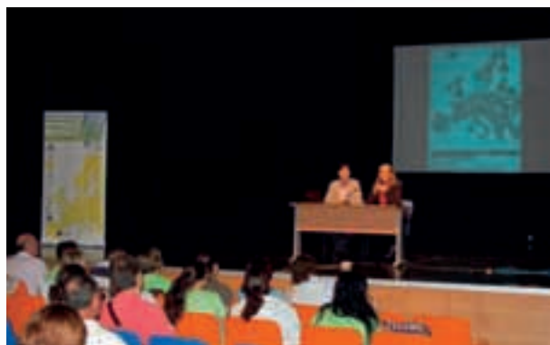
Jornadas comarcales "Empleo y Movilidad en la UE"

Cada sesión ha tenido una duración de cuatro horas y han participado unas 230 personas.