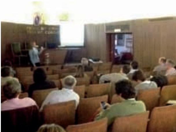
Seminario Financiación Europea

Se utilizó una metodología participativa, con un coloquio entre los participantes que intercambiaron opiniones sobre aspectos de interés relacionados con la temática.