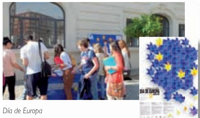
Día de Europa

Se organizó una mesa informativa por la que pasaron unos 300 estudiantes. Además, las 27 banderas de la UE ondearon en la balconada de la Facultad de Derecho.