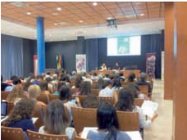
Debates sobre ciudadanía europea

En cuanto a los resultados, unos 800 alumnos han recibido formación en las distintas cuestiones abordadas en los Talleres y Jornadas descritos.