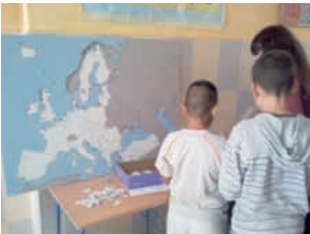
Taller la UE en la escuela