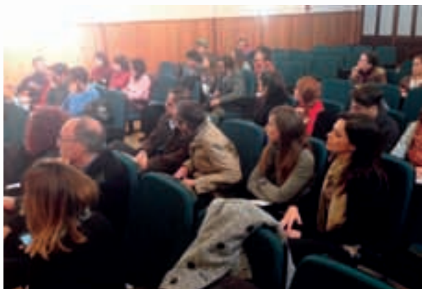
Asistentes a la jornada presencial del curso.

El Servicio de Recursos Europeos, a través de ED Málaga, con la colaboración de la Delegación de Educación y Juventud de la Diputación de Málaga y la Asociación Arrabal-AI organizaron en diciembre una acción formativa on line para profesionales de Juventud de la provincia, que contó con medio centenar de personas.