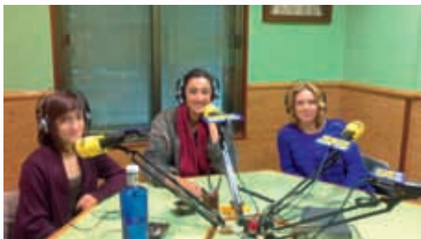
Programas especiales de radio sobre el Año Europeo 2013

Se realizaron 5 programas, 20 a 30 minutos de duración, en emisoras de diferentes localidades cordobesas. Participaron voluntarias europeas y personal del ED para informar y fomentar el conocimiento y el debate sobre los derechos ciudadanos en la UE. Redifusión en todas las emisoras.