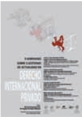
Seminario Derecho Internacional privado.