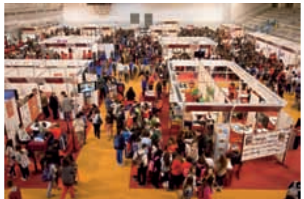
Salón del estudiante

Más de 12.000 estudiantes de centros de enseñanza de Sevilla y provincia tuvieron la ocasión de pasar por este Salón, en el que el ED Sevilla tenía un stand.