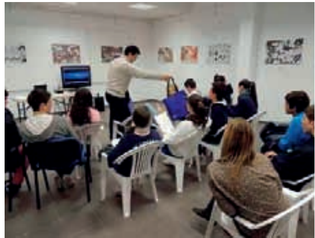
Taller Corresponsales Juveniles

Presentación del Servicio Europe Direct, difusión de actividades de interés juvenil y herramientas útiles para los jóvenes en Europa. Taller Servicio de Voluntariado Europeo y reparto de materiales (dossier del voluntario). Para que los corresponsales juveniles del municipio de San Roque y barriadas sirvan como factores multiplicadores de la información.