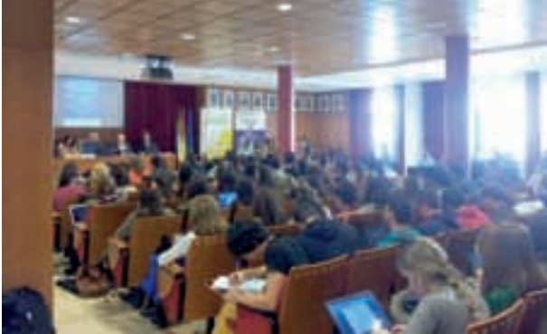
Seminario Acción Exterior.

Unos 420 alumnos han recibido formación en las distintas cuestiones abordadas en los Seminarios, Cursos y Jornadas descritos.