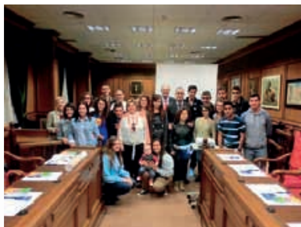
Taller Movilidad Almería

Los talleres se desarrollaron en Almería, Carboneras, Adra y Macael, y buscaban favorecer la movilidad laboral en el marco del Espacio Económico Europeo, aumentar el grado de concienciación de los ciudadanos sobre su derecho a residir libremente en el territorio comunitario, y poner en valor la utilidad de participar en programas europeos, que favorecen la movilidad como herramienta para favorecer el acceso al mercado laboral.