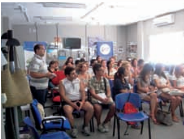
Taller movilidad Carboneras