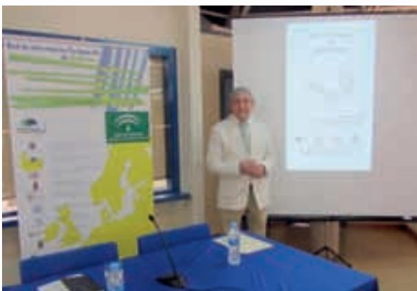
Director del Centro de Documentación Europea durante su intervención del 9 de Mayo.

Este Acto se retransmitió en directo a todo el mundo a través del Aula Virtual de la Universidad de Córdoba.