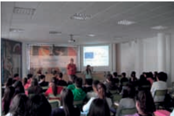
Campaña Bilingüe en IES sobre el Año Europeo de los Ciudadanos 2013.

El objetivo era comunicarles sus derechos como ciudadanos europeos y cómo el ejercicio de los mismos les da oportunidades en educación, formación y empleo en la UE. Más de 1.300 alumnos/as participantes.