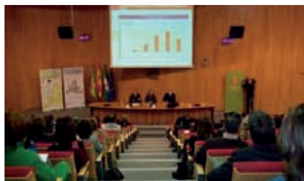
Conferencia "Escenario Financiero en la Europa 2020. Generación de Programas Europeos 2014/2020".

Con 5 horas de duración contó con la asistencia de 142 personas entre personal técnico y político de Entidades locales, Grupos de Desarrollo Rural, Mancomunidades y Consorcios y agentes socioeconómicos relevantes de la provincia de Granada.