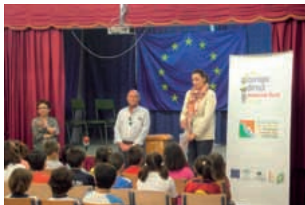
Talleres "Europa y tú" y Concurso "La Europa que quiero"

El objetivo era concienciar sobre la ciudadanía europea y fomentar la participación de los centros escolares en el proyecto europeo. Las entregas de premios se difundieron por los medios locales.