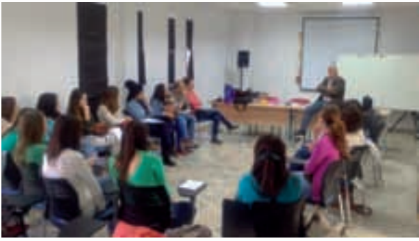
Talleres con jóvenes sobre la Estrategia Europa 2020

Se logró la información, motivación y formación de los jóvenes en los objetivos e iniciativas de la estrategia, incidiendo en la iniciativa Juventud en Movimiento, especialmente en el tema de movilidad; mejora de sus competencias orales en inglés.