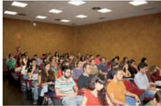
Curso sobre "La Unión Europea".

"Gestión de Proyectos Europeos", dirigido a gestores de fondos de las administraciones públicas y está subvencionado por la Consejería de Economía, Innovación, Ciencia y Empleo.