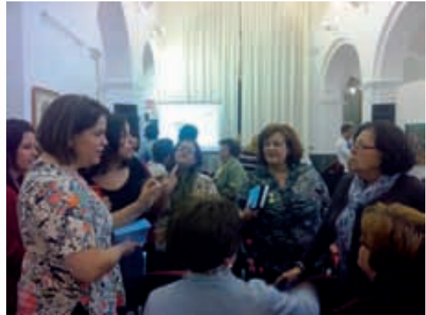
Personas asistentes a uno de los foros, desarrollado en Coín

ED Málaga ha desarrollado la campaña 'Se trata de Europa, se trata de tí', con motivo de la celebración del Año Europeo de la Ciudadanía.