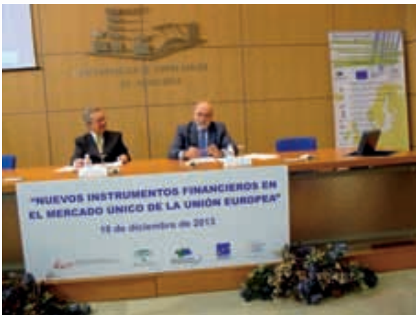
Imagen de la inauguración de la jornada

D. José Isaiás Rodríguez García-Caro, Vicepresidente del Comité Económico y Social Europeo, trasladó la necesidad de un Mercado Único vibrante como motor crucial para: una competitividad industrial europea renovada, una mayor innovación y una mayor creación de empleo. Traslado que para el CES europeo, una mayor integración y un mejor funcionamiento del Mercado Único constituye una de las prioridades clave para el futuro de la UE. Esta se debe hacer a través de una mejor transposición, implementación y aplicación de las normas de la UE en los Estados miembros.