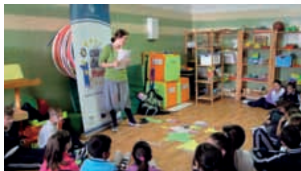
Niños en un Cuentacuentos

Un año más se ha celebrado esta actividad dirigida a niños/as de entre 5 y 9 años, cuyo objetivo es familiarizarlos con los