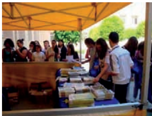
Stand informativo sobre el medio ambiente.

Dar a conocer los objetivos que persigue la Estrategia 2020 sobre el cambio climático, técnicas de reciclaje y cómo afecta el cambio climático si no ponemos remedio.