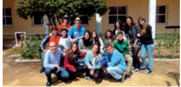
JACE (Participantes Colegio Alberto Durero)

El ED Sevilla participó por primera vez en JACE, en la VII edición del Premio Jóvenes Andaluces Construyendo Europa; el centro que presentó y asesoró el ED Sevilla fue el Colegio Alberto Durero de Sevilla que expuso un trabajo sobre la Política de Educación y Juventud en la UE.