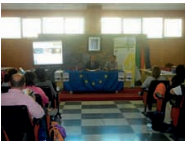
Taller movilidad Macael