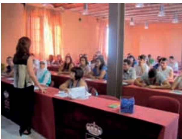
Taller movilidad Adra