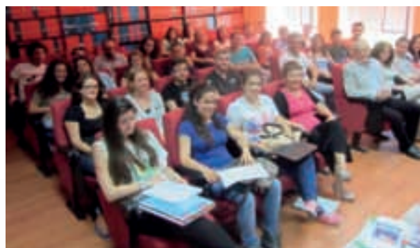
Alumnos participantes en el seminario.

Participaron cuarenta y siete personas, entre profesorado y alumnado de la Universidad de Córdoba.