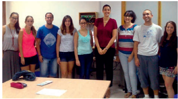
Ciudadanía europea en inglés

El objetivo acercar a los jóvenes la importancia de participar activamente en el proyecto europeo y aumentar su conocimiento sobre los derechos que tienen como ciudadanos europeos. Conocer la diversidad cultural y fomentar su interés por el aprendizaje de otras lenguas. Participaron 23 jóvenes.