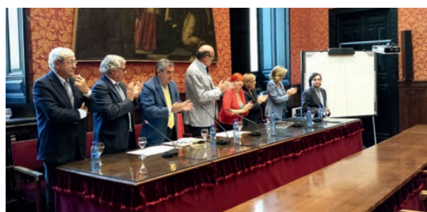
El galardonado del Premio de Investigación sobre Integración Europea

La Red de Información Europea de Andalucía convocó el "VIII Premio Andaluz de Investigación Universitaria sobre Integración Europea". Damos publicidad y difusión de las bases del premio a través del sitio web de la Red, correo electrónico y envío de carteles y folletos a instituciones y organismos público y privado de las ocho provincias andaluzas.