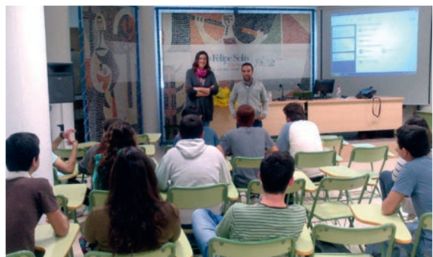
Entrega de regalos al grupo participante en JACE

El centro seleccionado fue el IES Felipe Solís Villechenous, de Cabra (Córdoba) con el que se llevaron a cabo dos sesiones previas al encuentro en Mollina, además de un acto de entrega de un recuerdo de su participación, tras el desarrollo de la fase final de JACE, que fue organizado en el propio centro educativo participante.