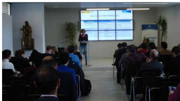
Asistentes a la Jornada "Horizonte 2020"

El día 27 de marzo se ha celebrado la Jornada Horizonte 2020 para informar al personal técnico de entidades públicas y empresas de la provincia de Huelva, sobre este nuevo programa. En la misma han participado unas 100 personas de diferentes entidades públicas y empresas de la provincia y como ponente han asistido representantes de la Comisión Europea, el Ministerio y la Junta de Andalucía.