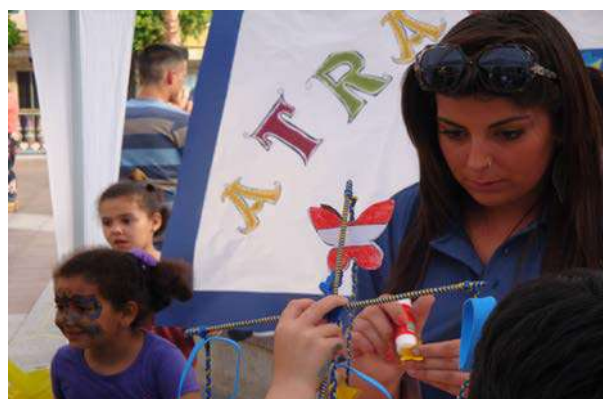
Día de Europa: Talleres Didácticos