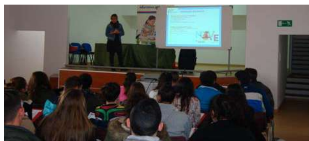
Jornada de Ciclos Formativos