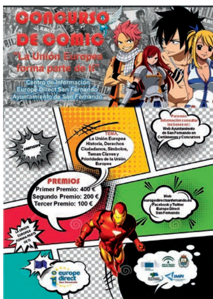
Cartel Concurso de Cómics Europe Direct San Fernando