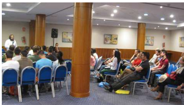
Movilidad en la Unión Europea

Tuvieron lugar en el Hotel Tryp Indalo Almería.