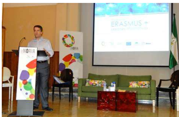
Clausura del acto con presencia del Diputado de Presidencia

Las sesiones se realizaron, de manera presencial, en Antequera, Archidona, Benalmádena, Campillos, Cártama, Pízarra, Rincón de la Victoria, Ronda, Vélez-Málaga, Yunquera y en Málaga capital.