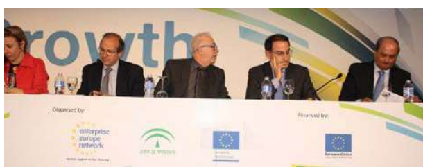
Participantes en una de las mesas redondas de la MFG Andalucía

Como resultado 964 empresas o instituciones participaron en el encuentro, donde se habían cerrado más de 2.400 reuniones que permitieron a las empresas andaluzas identificar y ser identificadas como posibles socios de negocio e inversión, en sus actividades comerciales, tecnológicas, y de internacionalización.