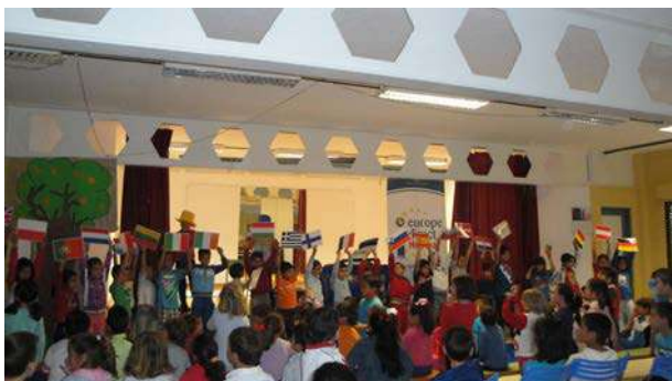
Cuentacuentos sobre la Unión Europea

los municipios han sido: Chucena, Villalba, Santa Ana la Real, Beas, San Bartolomé, El Almendro, Almonaster, Ayamonte, Huelva, y Villablanca.