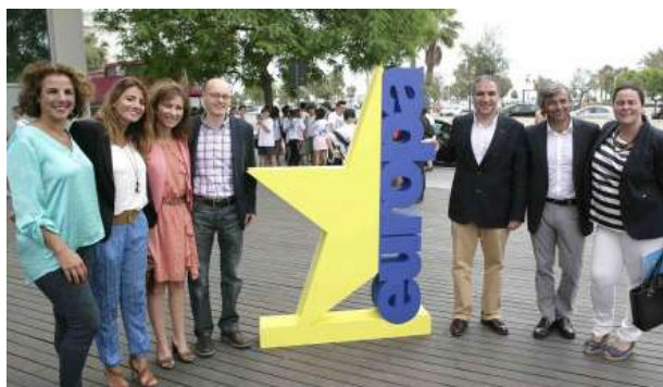
El Día de Europa se celebró en el Auditorio Edgar Neville de la Diputación de Málaga

Los objetivos de la celebración fueron dar a conocer la importancia del Día de Europa, y de los valores de la UE. Se dio a conocer la historia de la UE y su importancia en nuestra vida cotidiana. Con actos lúdicos se trata de aprovechar el evento para difundir los derechos de la ciudadanía.