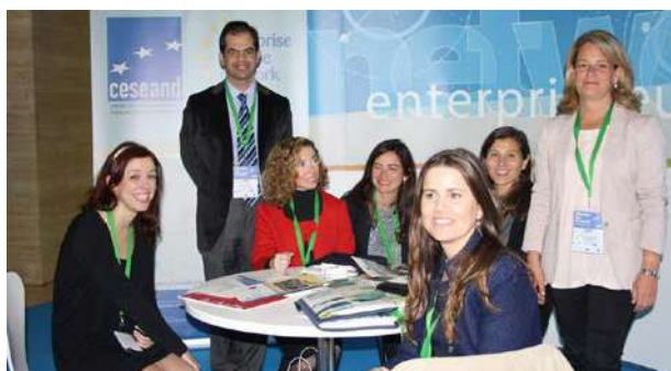
Stand informativo de los servicios de CESEAND durante la MFG Andalucía