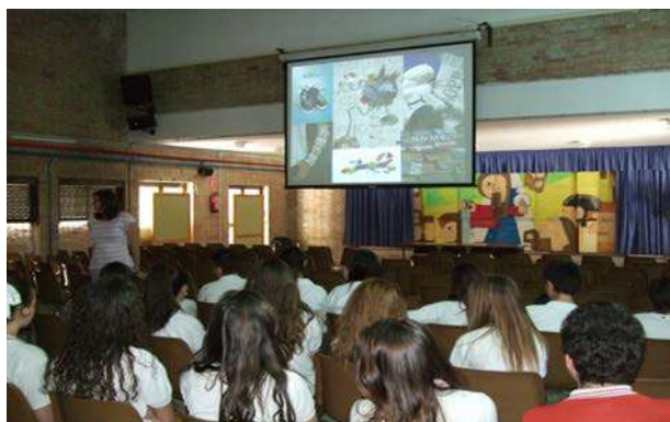
Celebración del Día de Europa en el centro educativo Caja Granada

Al acto asistieron, jugaron y participaron activamente del debate más de 200 jóvenes de 1º y 2º de bachillerato y 3º y 4º de ESO de este cativo.