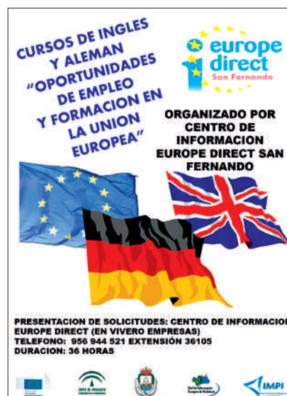
Cartel Cursos Idiomas Inglés y Alemán

El objetivo era alcanzar por parte del alumnado un mayor conocimiento y fluidez en la comunicación con ciudadanos de otros países, y potenciar las destrezas y capacidades comunicativas en los idiomas impartidos y utilizarlos como una herramienta adicional en actividades ligadas a la formación, a nivel educativo y laboral y, con ello mejorar sus oportunidades de empleo en el ámbito nacional y en los países de la Unión Europea. Muy buena acogida, como en años anteriores, por parte de la ciudadanía.