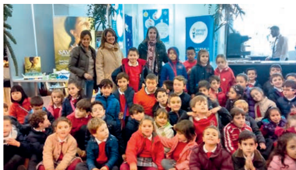
Niños visitantes en el Mercado Navideño

Celebrado el 5, 6 y 7 de diciembre, esta primera edición, organizada por la Diputación de Córdoba, a través del Consorcio Provincial de Desarrollo Económico, ha supuesto un plus en la oferta turística y comercial, y ha reunido a unos 25.000 visitantes en la explanada del Palacio de la Merced.