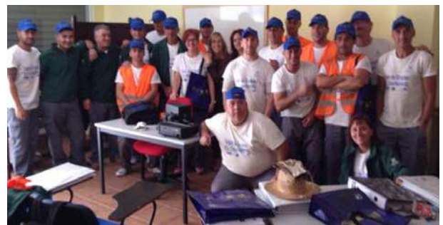
Actividad con el Taller de Empleo El Chaparral

Sesiones Informativas en Escuelas Taller, Talleres de Empleo y Casas de Oficios del Campo de Gibraltar. Presentación de diapositivas y emisión de videos relacionados con el Año Europeo de los ciudadanos y ventajas con las que contamos los ciudadanos europeos. Reparto de material promocional.