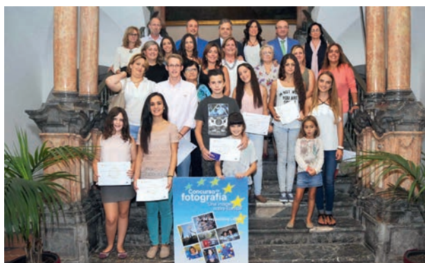
Concurso de fotografía: "Una imagen sobre Europa"

Dirigido a jóvenes residentes en la provincia de Córdoba. Se presentaron 120 fotografías.