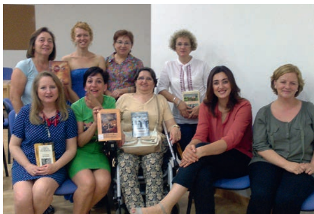
Taller de lectura europeo