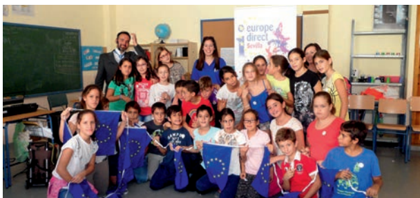
Niños en la actividad "La UE en las Escuelas"

El objetivo era difundir entre los alumnos de primaria los principios y valores de la UE, así como sus símbolos de una forma divertida. 125 alumnos de primaria se beneficiaron de esta actividad.