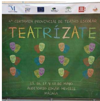
Cartel del IV Certamen provincial de Teatro Escolar

Celebrado en mayo, Teatrízate es un certamen para grupos de teatro integrados por escolares de Primaria, Secundaria y Bachillerato. ED Málaga participó en la fase final del certamen, en la que se realizó una actividad de animación relacionada con la Unión Europea con música y juegos para los escolares asistentes. Se distribuyó material divulgativo para los participantes en la gala inaugural. Para el resto de sesiones de la fase final se contó con un stand de Europe Direct que distribuyó mapas, folletos y material de otros proyectos europeos.