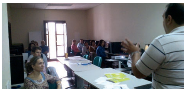
Talleres sobre la vendimia francesa y empleo agrícola

El 3 y el 16 de Julio organizamos sesiones informativas para las personas en renta de inserción agraria interesadas en la Vendimia en Francia. Se enmarcan dentro de las actividades de la Bolsa de Movilidad Europea de nuestro centro.