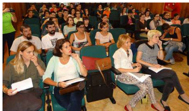
Participantes al acto de clausura