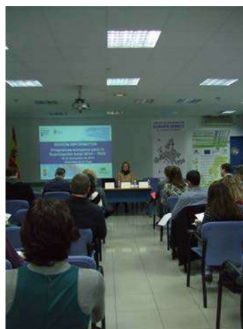
Asistentes a la Sesión Informativa sobre Financiación Local 2014/2020

Un total de 100 técnicos/as municipales de cuatro comarcas de la provincia de Granada se han beneficiado de esta formación.