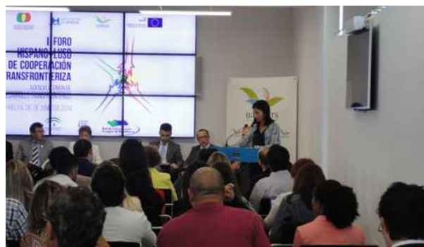
I Foro Hispano-Luso del Sur de Cooperación Transfronteriza

El día 26 de junio el Centro de Información Europea organizó, junto con otros servicios de la Diputación de Huelva, un gran evento Transfronterizo en nuestra provincia que reunió a destacadas personalidades de ambos lados de la frontera, así como a especialistas en la materia. En el mismo participaron representantes de las instituciones europeas y de instituciones nacionales y regionales, españolas y portuguesas, que trabajan en la cooperación transfronteriza.