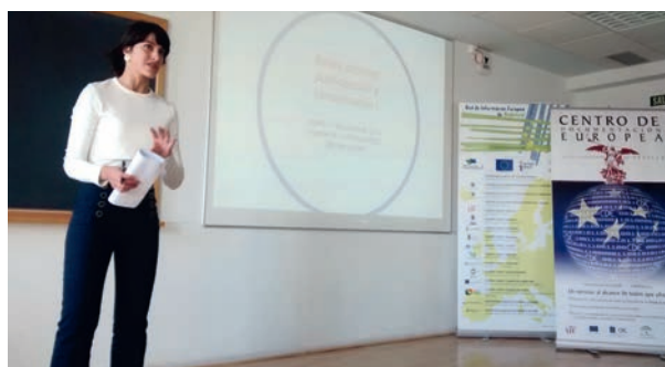
Curso sobre la Unión Europea

De 30 horas lectivas. Para formar a alumnos de la Facultad de Ciencias de la Comunicación y periodistas en cuestiones básicas sobre la UE: historia, instituciones, ordenamiento jurídico, políticas comunes, etc. Este curso tiene 3 créditos de libre configuración y concluyeron la formación 46 alumnos.