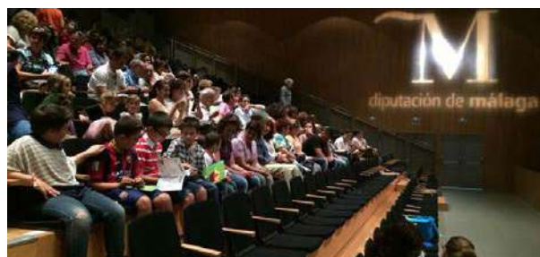
Vista general del auditorio con los participantes al certamen

Los objetivos eran difundir entre los escolares, especialmente a los de Primaria, nociones básicas sobre la UE, exponer los principales valores sobre los que se asienta, concienciar a los escolares sobre la importancia de unir fuerzas, actuar conjuntamente y trabajar en equipo.