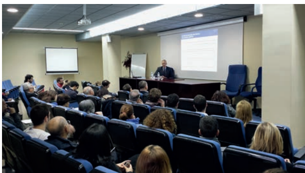
Jornada sobre Plan de Inversiones

Impartida el 4 de diciembre por D. Juergen Foecking, Consejero Económico en la Oficina de Representación de la Comisión Europea en España. El tema suscitó gran interés ya que, ante los riesgos de una nueva recesión, la Comisión Europea avanzó un macro plan de inversión de 300.000 millones de euros con un nuevo vehículo financiero público-privado: el "Paquete Juncker".