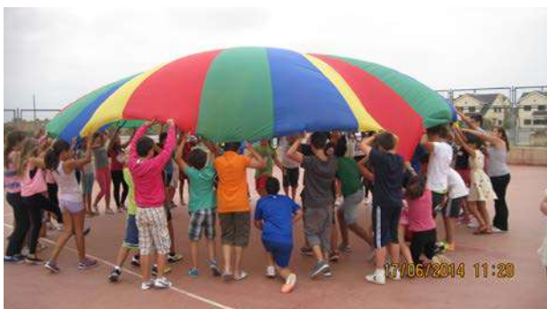
Actividades en la Semana Europea de la Energía

Con motivo de la Semana Europea de la Energía, nuestra oficina ha organizado dos Gymkanas energéticas dirigidas al alumnado de dos cursos diferentes del CEIP "Pura Domínguez" de Aljaraque. Estas dos sesiones tuvieron lugar el 17 de junio.