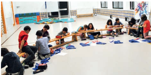
Niños en la actividad "La UE en las Escuelas"

El ED se puso en contacto con una empresa de animación para organizar un Cuentacuentos denominado "La maleta de Schuman" cuyo fin era trabajar con los alumnos de primaria cuestiones básicas relacionadas con la UE (países, símbolos, historia, etc.). Esta actividad se completaba con un taller de chapas en el que los alumnos podían crearse su propia chapa haciéndose un dibujo relacionado con la UE y convirtiéndose en embajadores de la Unión.