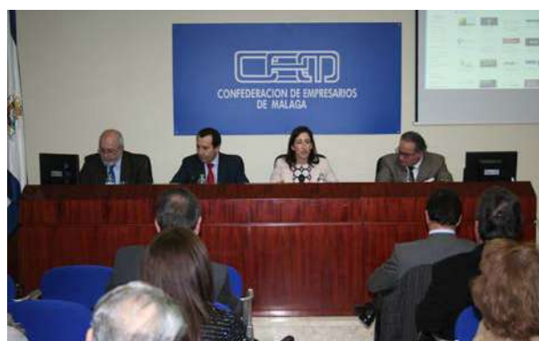
Participantes en la Jornada

El objetivo de la jornada organizada por el CESEAND de CEA es sensibilizar al tejido empresarial de la necesidad de llevar a cabo un proceso de reindustrialización en Andalucía, y difundir las medidas y programas que, con este fin, les ofrecen la Comisión Europea, el Gobierno de España y la Junta de Andalucía, ya que Andalucía afronta un problema debido a la baja aportación del sector industrial comparado con el resto de Europa y es un hándicap a la hora del alcanzar el objetivo del 20% del PIB en el año 2020.