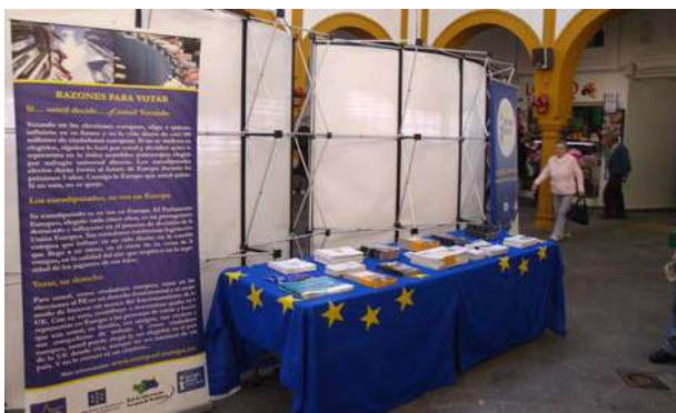
Exposición sobre el Parlamento Europeo

El voto en las elecciones europeas es la oportunidad que el ciudadano tiene para influir en la composición del PE y en las decisiones de este durante los cinco años de legislatura; con el objetivo y de motivar a los ciudadanos a que voten en las elecciones al PE se organiza esta exposición en los siete