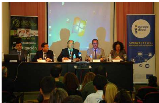
Jornadas Horizonte 2020

La Fundación Campus Tecnológico, en colaboración con nuestra oficina, organizó unas jornadas para dar a conocer las oportunidades de financiación enmarcadas en el Programa Horizonte 2020, que se celebraron el 21 de noviembre en Algeciras.