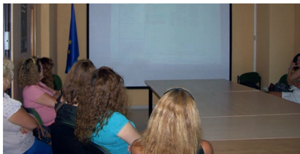
Alumnas Sesiones Informativas impartidas por Europe Direct San Fernando

Se ofrece una especial dedicación a los temas relacionados con la Juventud (Programa Erasmus +, Juventud, Eurodesk, Ploteus, Eures y otros).