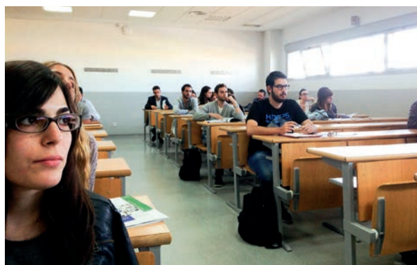
Asistentes al curso sobre la Unión Europea

De 30 horas lectivas. Para formar a alumnos de la Facultad de Ciencias de la Comunicación y periodistas en cuestiones básicas sobre la UE: historia, instituciones, ordenamiento jurídico, políticas comunes, etc. Este curso tiene 3 créditos de libre configuración y concluyeron la formación 46 alumnos.