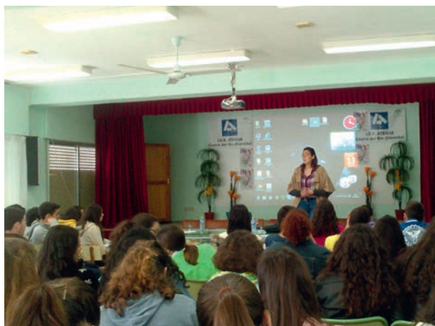
Taller de Orientación en el IES Ategua

Para 300 jóvenes durante la mañana, y por la tarde se llevó a cabo un taller para padres junto con la orientadora del centro educativo. Información para incluir el espacio europeo entre las posibilidades que barajan los recién titulados en FP o las personas que deciden seguir estudiando y hablar sobre las diferentes posibilidades que pueden tener los jóvenes en el marco de programas europeos o de sus derechos como ciudadanos de la UE.