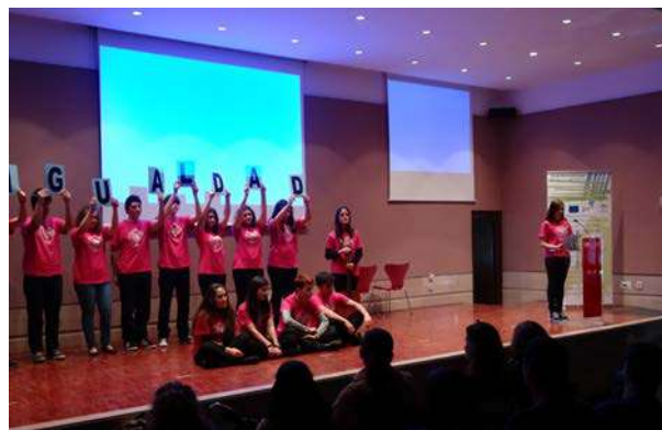
Representación escénica del alumnado del centro escolar.

A la provincia de Málaga le correspondió el tema "IGUALDAD DE OPORTUNIDADES ENTRE HOMBRES Y MUJERES EN LA UE". Después de remitir las bases e información del premio a 120 centros de Bachillerato y de ciclos formativos de grado medio, se presentaron diversas propuestas, y resultó seleccionada la de los alumnos de 1º de Bachillerato del I.E.S. Dr. RODRÍGUEZ DELGADO, de Ronda, que presentaron en Mollina, en la fase final, una composición mixta de teatro, proyección audiovisual y acompañamiento musical. El centro quedó en tercer lugar.