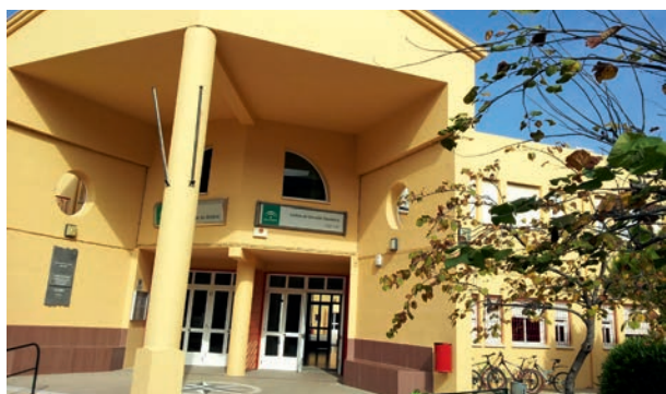
Fachada principal IES Jorge Juan de San Fernando

En algunas ocasiones, las sesiones dedicadas al Programa Erasmus + se realizan en colaboración con la Delegación Provincial del Instituto Andaluz de la Juventud.