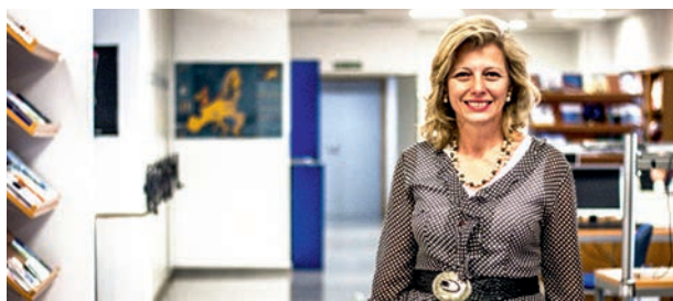
Entrevista en la TV a la directora del ED