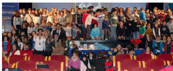
Participantes en el encuentro de Intercambio de adornos navideños