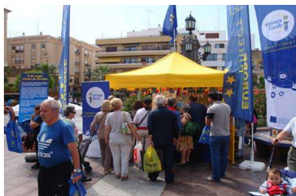
Día de Europa: Punto de Información

Ubicación de Punto de Información y Consulta en Stand situado en la Plaza Alta de Algeciras. Acto de izada de Bandera Europea por parte del Presidente de nuestra Entidad y otros representantes políticos de la Comarca del Campo de Gibraltar. Entrega de material promocional a todos los asistentes, cuestionarios y recogida de consultas sobre la UE.