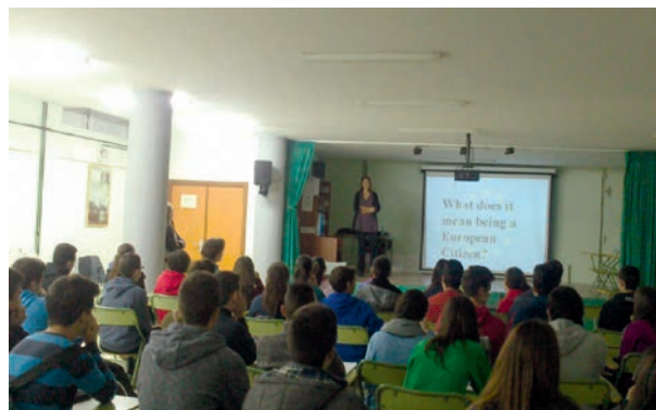
Campaña bilingüe sobre ciudadanía dirigida a IES

Se difunde entre todos los centros de secundaria de la provincia que imparten bachillerato, los institutos pueden elegir día, número de sesiones e idioma (español o inglés). El personal del ED se desplazó a los 17 centros solicitantes de educación secundaria, con el objetivo de comunicar a los jóvenes sus derechos como ciudadanos europeos que les ofrece oportunidades en relación con la educación, formación y el empleo en la UE. 2.000 jóvenes participaron en las 50 sesiones.