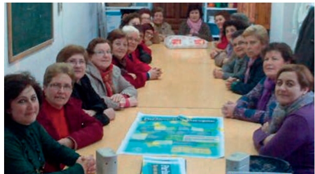
Talleres sobre Parlamento Europeo con Asociaciones de mujeres

Para familiarizar a recientes usuarias o no usuarias de Internet con sus posibilidades en torno al acceso a la información europea, al tiempo que fomentar su alfabetización digital. 15 usuarias formadas.