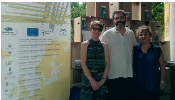
Personal CDE en el stand de la Noche de los Investigadores

El Centro de Documentación Europea ha participado, un año más, en la organización y presentación de la Noche de los Investigadores. En esta ocasión este Acto se ha celebrado en el patio de los Naranjos de la Mezquita-Catedral de Córdoba con una importantísima afluencia de alumnos y alumnas de la Universidad, jóvenes de secundaria y público en general. El personal del Centro de Documentación Europea estuvo en el stand de éste atendiendo a todas las personas que quería saber e informarse sobre cuestiones de la UE y del propio Centro para visitar y solicitar documentación.