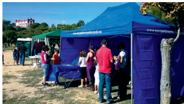
Stand del Centro de Información Europe Direct. Celebración Día del Cerro

Celebrado el 26 de octubre con la inauguración de un stand de carácter promocional y divulgativo sobre las publicaciones y servicios ofrecidos por nuestra oficina; se distribuyeron gran cantidad de folletos y artículos promocionales. Además se realizaron talleres y actividades lúdicas y educativas para el público infantil, impartidas por monitores con amplia experiencia en talleres de animación.