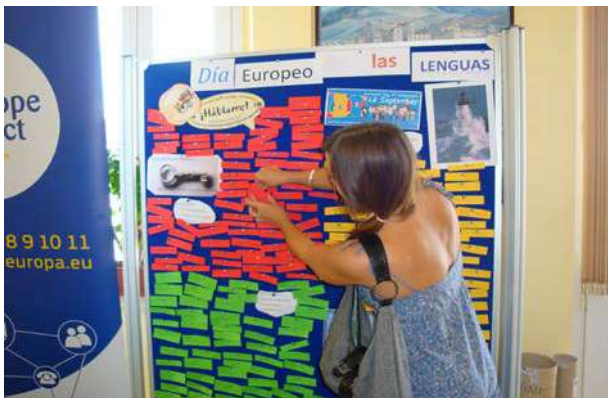
Día Europeo de las Lenguas

Ubicación de paneles informativos sobre el Día Europeo de las Lenguas, y reparto de material promocional en las Escuelas Oficiales de Idiomas de San Roque y Algeciras. Organización de talleres sobre palabras claves de las lenguas, impartidos en los centros, y donde ciudadanos en general, alumnos y profesores participaron. El objetivo alertar sobre la importancia del aprendizaje de idiomas y diversificación de la gama de lenguas, a fin de incrementar el plurilingüismo y la comprensión intelectual y fomentar el aprendizaje permanente de idiomas, dentro y fuera de las escuelas.