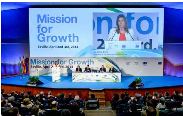
La Presidenta de la Junta Andalucía en la actividad Misión para el Crecimiento

CESEAND, nodo Andaluz de la Enterprise Europe Network, organizó en esta "Misión para el Crecimiento" los encuentros Empresariales cuyo objeto fue facilitar, a través de reuniones bilaterales, oportunidades de negocio entre empresas, permitiendo a los participantes detectar posibilidades de colaboración y conocer nuevos socios comerciales, tecnológicos o para proyectos de innovación.