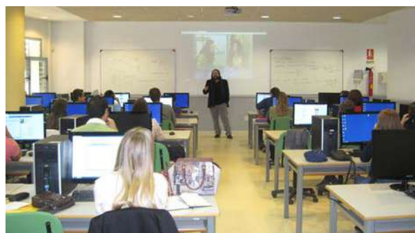
Jornada "Redacción del CV Europass"

El contenido: El CV Europass. Se pidió a los asistentes que se llevaran en un pendrive su foto y CV para trabajar sobre él. La actividad se realizó en el aula informática de la Universidad para facilitar el trabajo.