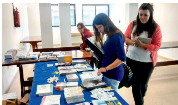
Stand con información en el Día de Europa

Para conmemorar el Día de Europa se han realizado diferentes actividades: stand informativo, panel tematizado y un Seminario en el seno de la Universidad. Se celebró el 22 de mayo.