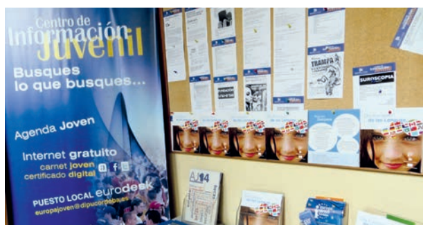
Stand y folleto sobre Día Europeo de las Lenguas

Realización y difusión de un políptico informativo en soporte papel. Con una tirada de 500 ejemplares. El objetivo fue dar a conocer la Semana Europea de las Lenguas y el multilingüismo de la UE.