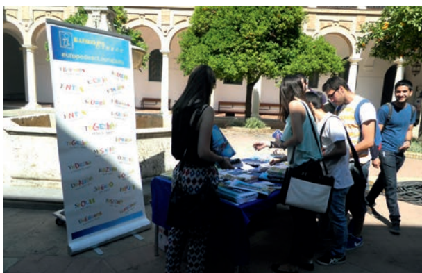
Algunos alumnos y alumnas en el stand instalado el Día de Europa

Con motivo de la Conmemoración del Día de Europa realizamos un stand en la Facultad de Derecho y Ciencias Económicas y Empresariales al que acudieron numerosos alumnos y alumnas y profesores y profesoras.