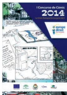
Portada Comic "La Unión Europea forma parte de ti"

Otras Publicaciones : Un Díptico Europe Direct San Fernando, un Mapa Unión Europea, un Puzzle Unión Europea y un Videoclip de Europe Direct San Fernando.