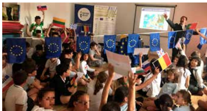
Día de Europa

El evento contó con el desarrollo de un flashmob sobre la bandera de Europa, y un espectáculo sobre magia relacionado con la UE. Entrega de material promocional relacionado con el evento a todos los asistentes, cuestionarios y recogida de consultas sobre la Unión Europea.