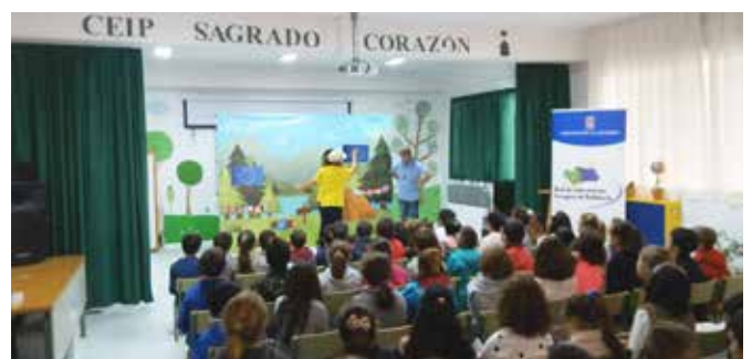
Teatro en CEIP SAGRADO CORAZÓN

A lo largo de 2018 se han atendido 19 peticiones, de las cuales 7 han sido financiadas por la subvención nominativa de la Red y las 12 restantes con fondos propios de la Diputación.