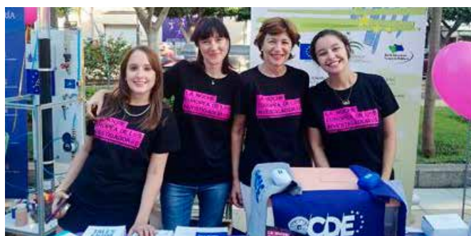
Noche Europea de los Investigadores

El CDE participó en la 13ª edición de la Noche Europea de I@s Investigador@s con un stand informativo sobre sus actividades y servicios. Se presentaron actividades relacionadas con el papel de la mujer en la ciencia y la investigación como un concurso de cartas informativas “Conoce a las mujeres europeas en la investigación”. También se realizó un concurso de dibujo, “El mejor invento del mundo mundial”, con la intención de acercar la ciencia al público infantil. La actividad tuvo aproximadamente un total de 3000 participantes.