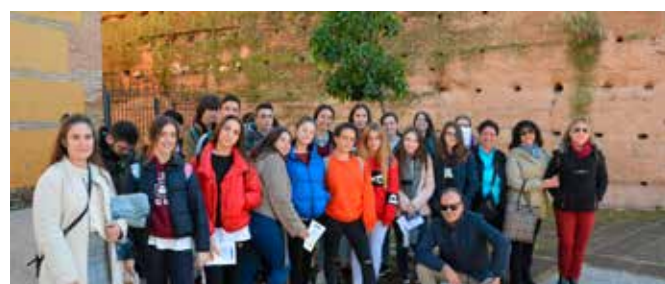
Taller infantil sobre la UE