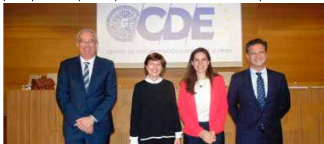
Jornadas "El Futuro de Europa"

de integración. Informar sobre los servicios del Centro y animar a los participantes a que se apunten a nuestra lista de suscripción.