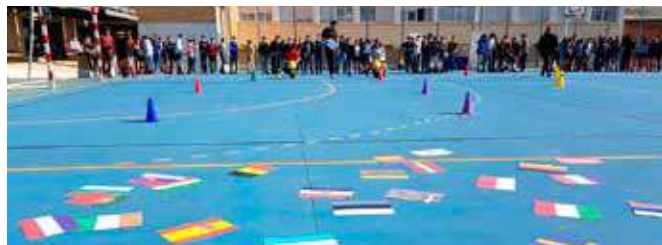
Gymkanas sobre la UE

Con esta actividad se ha fomentado el conocimiento de la Unión Europea entre los alumnos de enseñanza secundaria. A través de las pruebas a los que se sometían a los alumnos éstos han incrementado el conocimiento de la UE y los países que la conforman. 200 alumnos.