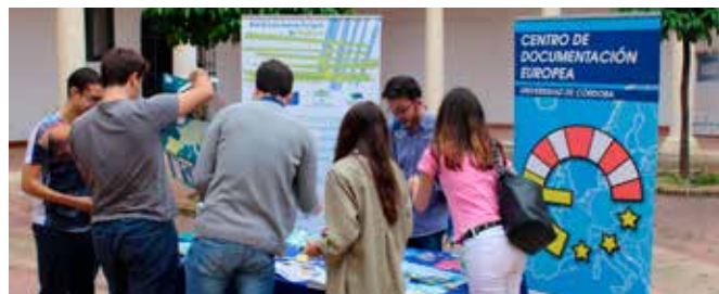
Asistentes en el Día de Europa

Con motivo de este día se instaló un stand en la Facultad de Derecho y Ciencias Económicas y Empresariales al que acudieron alumnas y alumnos, muchos de los cuales eran ERASMUS, así como el profesorado, para festejar el Día de Europa, difundir sus valores y dotar a los interesados de material formativo en materia europea.