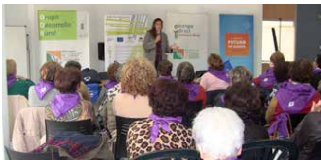
Diálogo con Asociaciones de Mujeres

Inspirado por los diálogos ciudadanos impulsados por la Comisión Europea, el debate sobre los temas prioritarios en el marco del futuro de Europa y de las elecciones al Parlamento Europeo en 2019 viajó por pueblos y aldeas de Córdoba. En concreto se llevaron a cabo 6 diálogos con personas mayores y con grupos de mujeres en Valenzuela, Llano del Espinar, Castro del Río y Baena. Se grabaron microvídeos de los debates para difundir posteriormente los resultados.