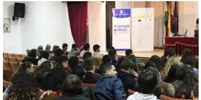
Taller sobre Movilidad Europea