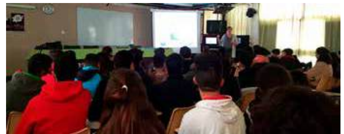
Taller en inglés sobre Derechos y Movilidad

Del 16 al 27 de julio impartimos en Baena estos 8 talleres de 3 horas y media de duración conectados entre sí en el marco de los temas prioritarios de la UE para 2018 y en el contexto del debate sobre el futuro de Europa. En los talleres se empleó una metodología participativa y de aprendizaje en el ámbito no formal y participaron una media de 15 jóvenes en cada uno de los talleres.