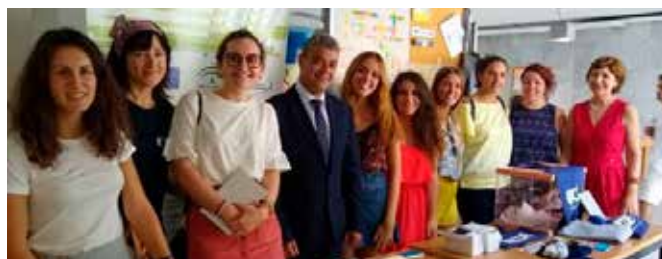
Stand en el Día Europeo de las Lenguas

Para celebrar el Día Europeo de las Lenguas y la riqueza lingüística europea, el Centro de Documentación Europea de Almería preparó un stand informativo desde donde informó a los asistentes de los servicios del CDE, entre ellos, del fondo digital y boletines. Se repartió material divulgativo y se realizó un concurso para probar los conocimientos de los participantes en otras lenguas de la Unión Europea. La actividad tuvo un total de 120 participantes.