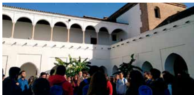
Erasmus y jóvenes de la provincia de Huelva

Esta actividad ha sido la contribución de la provincia de Huelva, a través del Centro de Información Europea "Europe Direct Huelva", a las celebraciones del Año europeo del Patrimonio Cultural 2018.