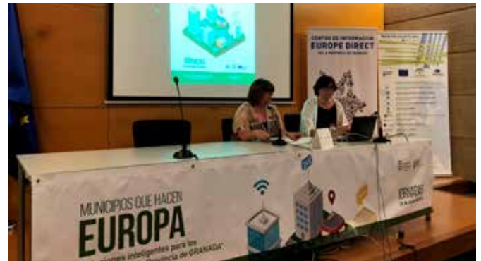
Inauguración de las Jornadas

El 11 de julio y 13 y 20 de noviembre, se celebraron estas sesiones dirigidas a informar a jóvenes de entre 18 y 30 sobre qué es y cómo participar en el Cuerpo Europeo de Solidaridad.