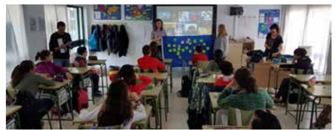
Viernes de Europa