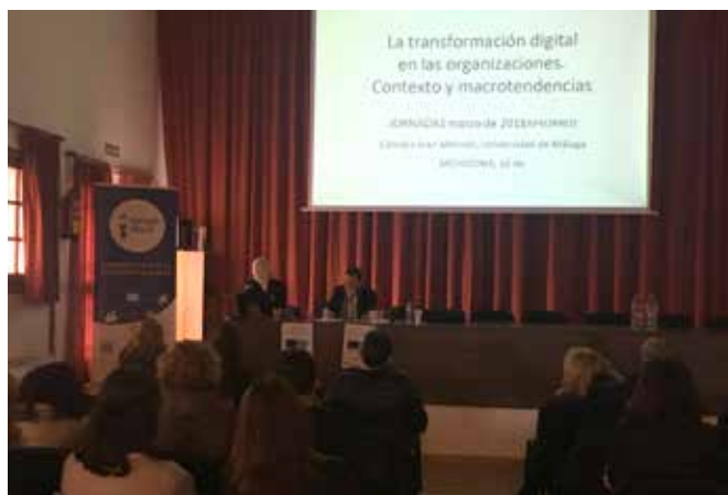
Participantes de la VI Jornada Aproved

Con la realización de esta Jornada se ha conseguido aumentar el nivel de conocimiento en proyectos europeos relacionados con el sector agroalimentario.