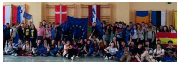
Día Europeo de las Lenguas en EEPP SAFA (Andújar)

Al final realizamos un Scrabble gigante con palabras en diferentes lenguas y la audición del Himno de Europa ante las 28 banderas de la UE. Entrevista para Cadena Ser.