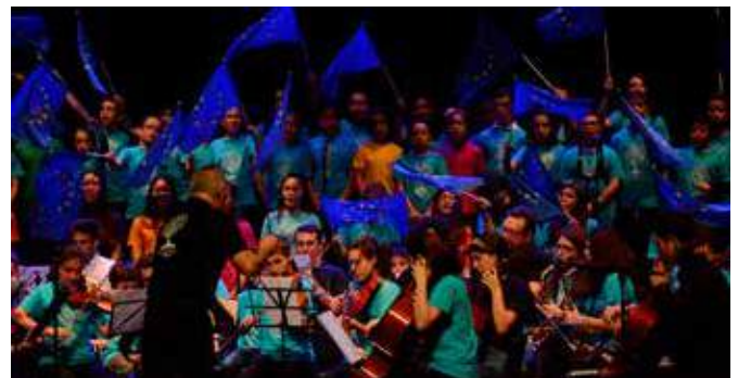
Actuación del Conservatorio de Música "Juan de Castro"