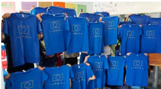
Celebraciones en el municipio de Valenzuela