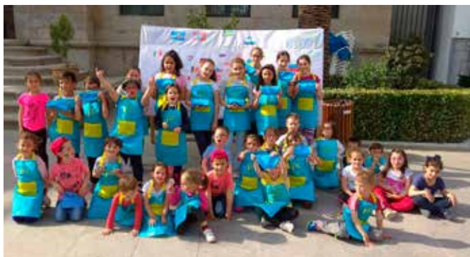
Celebraciones en el municipio de Belalcázar

Dos Torres, El Carpio, El Guijo, El Viso, Espejo, Fernán Núñez, Los Silillos, Villalón, La Ventanilla, Cañada Rabadán, El Villar, Fuente-Tójar, Fuente La Lancha, Iznájar, La Rambla, Los Blázquez, Lucena, Montemayor, Montilla, Montoro, Monturque, Palma del Río, Pedro Abad, Pedroche, Peñarroya-Pueblonuevo, Posadas, Priego, Puente Genil, San Sebastián de los Reyes, Santa Eufemia, Valenzuela, Valsequillo, Villa del Río, Villafranca, Villanueva del Duque, Villanueva del Rey, Zuheros.