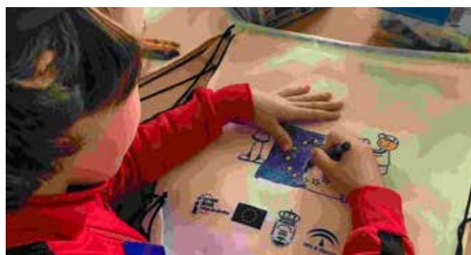
Día Europeo de las Lenguas

Los objetivos eran alertar al público sobre la importancia del aprendizaje de idiomas y diversificación de la gama de lenguas, a fin de incrementar el plurilingüismo y la comprensión intelectual. Promover la rica diversidad lingüística y cultural de Europa y fomentar el aprendizaje permanente de idiomas dentro y fuera de las escuelas.