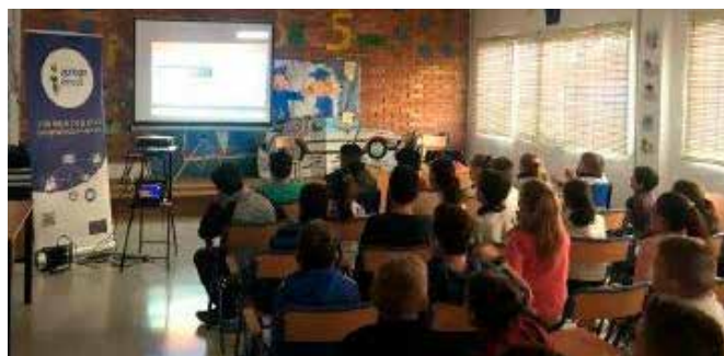
Alumnos de Primaria durante las sesiones

El propósito de estas charlas es mejorar el conocimiento de los alumnos sobre la Unión Europea, divulgar su historia, sus símbolos, principales hitos y el funcionamiento, a la vez que se resalta la importancia que tiene en nuestros día a día las decisiones que se adoptan en el seno de la UE.