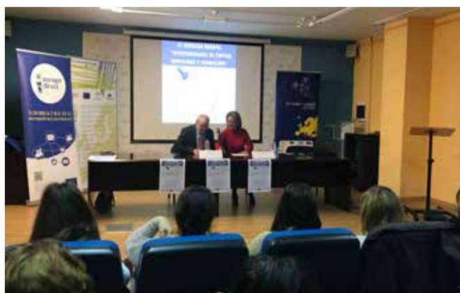
IV Jornada “Europa: Oportunidades de Empleo, Movilidad y Formación”

La jornada está destinada a jóvenes universitarios, desempleados y ciudadanos en general interesados en temas europeos.