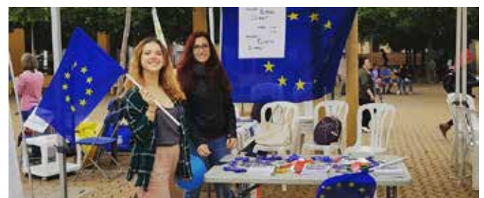
III Muestra Anual de Comunicación en el ámbito educativo

En la Muestra anual de comunicación en el ámbito educativo se contó con un stand en el que los alumnos pudieron trabajar distintos aspectos relacionados con la UE. Casi 2000 alumnos acudieron a esta cita.