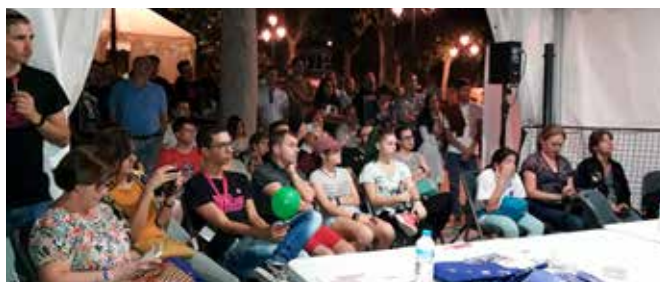
Stand en la Noche Europea de los Investigadores

El CDE se sumó a la Noche Europea de los investigadores. Estuvo presente el 28 de septiembre en uno de los stands del Paseo del Salón de Granada con dos actividades dirigidas al público en general. Por un lado conocer qué es y para qué sirve un acelerador de partículas, y por otro, informar sobre las oportunidades de empleo, becas y premios que la UE convoca en el ámbito de la ciencia y la investigación.