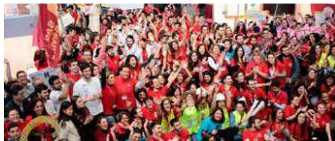
Salón del Estudiante

En estas actividades se colocaron stands con material de divulgación y merchandising; para ello se solicitó a Eubookshop y a la Representación de la CE en España material promocional y folletos divulgativos relacionados con la política de juventud, formación y empleo en la UE y la política de investigación y desarrollo en la UE.