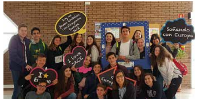
Participantes en JACE del Colegio Alberto Durero

El ED Sevilla participó en la XII edición del Premio Jóvenes Andaluces Construyendo Europa con el Colegio Alberto Durero, de Sevilla, que presentó un trabajo sobre 'Crecimiento y empleo en la UE'.