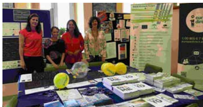
Escuela Oficial de Idiomas de San Roque

Ubicación de stand con material promocional con motivo de este día en la Escuela Oficial de Idiomas de San Roque, y actividad didáctica con los alumnos con el objetivo de que los estudiantes y otros ciudadanos que visitaban el stand colocaran palabras originales para ellos en otros idiomas de la UE en un panel gigante. Realizamos un Taller sobre: "Rarezas lingüísticas", palabras que no tienen traducción, sólo tienen significado en su propia lengua.