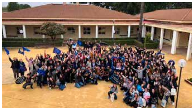
Grupo de participantes en JACE

Por parte de la provincia de Málaga concursó un grupo de Primer Ciclo Formativo de Grado Medio del IES Vega de Mar, ubicado en San Pedro de Alcántara, con el tema “Derechos Fundamentales en la Unión Europea”.