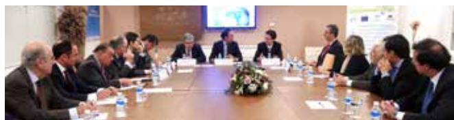
Ponentes durante la inauguración del Seminario

El objetivo era informar al empresariado andaluz de uno de los países con mayor potencial para los negocios del mundo, que cuenta con una población de más de doscientos millones de habitantes y dispone de recursos propios muy importantes, que lo sitúan como la novena potencia económica del mundo a través de la opinión de expertos en la materia.