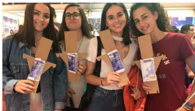
Universitarias con el folleto en las Jornadas de Recepción de Estudiantes

Se editaron un total de 1000 ejemplares de este folleto dirigido a jóvenes de la provincia, con el objetivo de explicar a estos jóvenes nuevos votantes por qué es importante que participen en los comicios europeos del 26 de mayo.