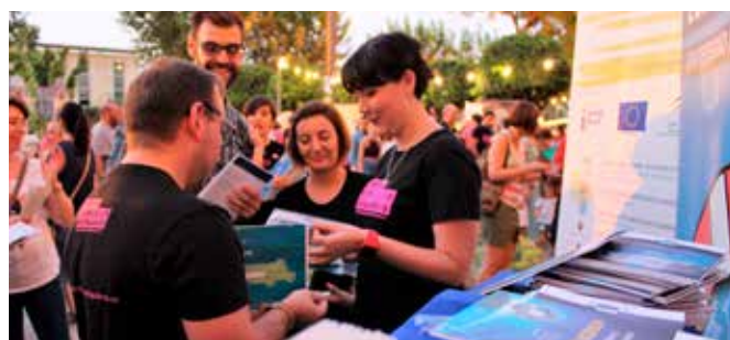
La Noche Europea de los Investigadores

Como en años anteriores, se nos solicitó desde el Rectorado de la Universidad de Córdoba nuestra participación en la organización de "La Noche de los Investigadores", que este año se celebró en los Jardines del Rectorado, el 28 de septiembre. Con esta actividad perseguimos difundir las actuaciones por parte de la UE en relación con la ciencia y la investigación. Contamos con un numeroso grupo de participantes, entre profesores, estudiantes y público en general.