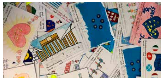
Postales ilustradas por los alumnos

En total participaron 220 alumnos y alumnas de primaria.