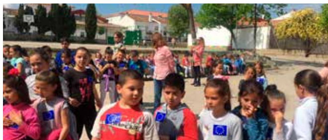
Alumnos CEIP Francisco Ayala de Iznalloz

Así mismo, los colegios CEIP Francisco Ayala de Iznalloz y CEIP Luis Rosales de Granada se unieron en la celebración con la lectura de un manifiesto, reproducción del himno de la UE y participación del alumnado, contribuyendo el CDE con material y documentación sobre la UE.