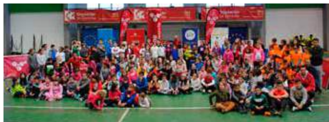
Hinojosa del Duque, 27 de octubre

En Cañete de las Torres, Hinojosa del Duque, Iznájar, La Victoria y Nueva Carteya. Con el fin de promocionar deportes menos conocidos entre los jóvenes de nuestra provincia, y celebrar una actividad lúdica con un carácter europeo en los municipios de la provincia. Apoyar la realización de eventos destinados a la ciudadanía. Participación de 565 jóvenes.