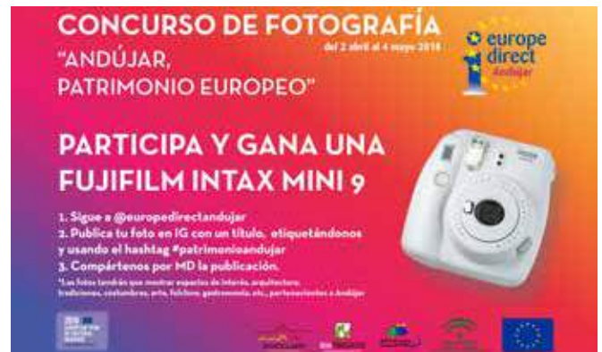
Cartel del Concurso de Fotografía en Instagram