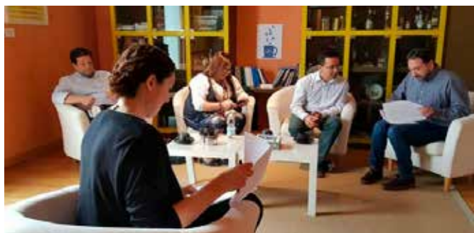
Café Europa con representantes políticos

Se trata de una actividad de debate local sobre el futuro de Europa en la que hemos participado tres CIED andaluces (Andalucía Rural, Andújar y Campo de Gibraltar). Nosotros hemos realizado tres sesiones de más de dos horas de duración cada una que han reunido a representantes políticos, asociaciones y jóvenes, respectivamente. A partir de los debates y para difundir sus resultados, nuestro centro ha realizado tres vídeos que se han dado a conocer por redes sociales.