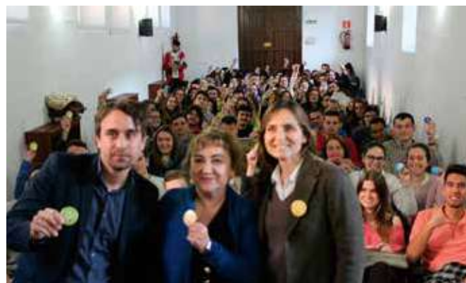
Grupo de la sesión de tarde de mayo 2019: tú eres el futuro DE EUROPA.

Se visitaron diferentes centros de la Universidad de Córdoba para informar a los alumnos sobre las elecciones al Parlamento Europeo a través de entrevistas, vídeos, documentación, stands informativos en materia europea y otros. También se llevó a cabo una actividad central con un carácter algo más institucional y de formación de la mano de expertos en la Unión Europea Universidad de Córdoba.