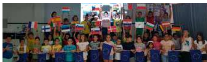
Alumnos de primaria

• Gymkana: Con esta actividad se ha fomentado el conocimiento de la Unión Europea entre los alumnos de enseñanza secundaria. A través de las pruebas realizadas, los alumnos, incrementan el conocimiento de la UE y de los países que la conforman.