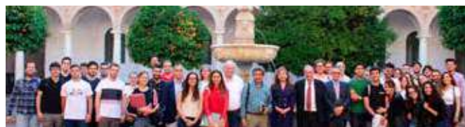
Foto de grupo en el Patio Barroco de la Facultad de Derecho y CC EE y EE

Brexit; el Brexit y su impacto económico. Este seminario constaba de 1 crédito ECTS. Contó con una participación de 81 asistentes.