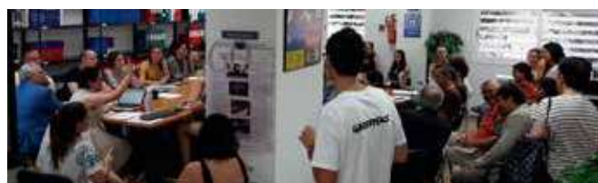
Momento debate sobre medio ambiente

de la Unión Europea" el 14 de octubre, debatiendo posteriormente con los asistentes sobre la cuestión de Gibraltar, los derechos de los ciudadanos y los cambios que se prevén.