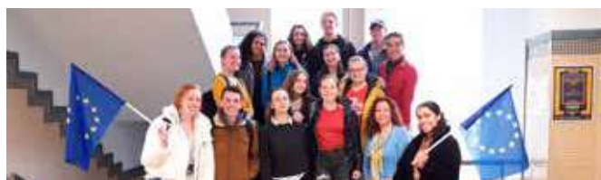
Conociendo el funcionamiento de redes de información europeas

El 28 de noviembre impartió también esta charla al alumnado de 1º curso de grado en Información y Documentación de la facultad de Comunicación y Documentación de la Universidad de Granada.