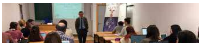
Curso "La Unión Europea"

ECTS o 2,5 créditos de libre configuración y concluyeron la formación 39 alumnos.