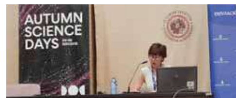
Autum Science Days

Evento científico organizado por la Escuela Internacional de Doctorado de la Universidad de Almería, con el patrocinio de la Diputación de Almería y través del Programa Europeo “Europe Direct”, durante los días 24-27 de septiembre de 2019.