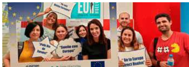
Escuela oficial de idiomas

Por dicho stand pasaron todas las clases de la escuela, en sus diferentes idiomas.