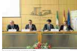
Un momento de la jornada organizada por la CEA.

Durante los meses de enero a febrero se mantuvo una campaña en redes sociales de sensibilización de los beneficios para las PYMEs andaluzas de los acuerdos comerciales (FTAs: Free Trade Agreements) de la UE con terceros países o regiones económicas. Se han introducido a través de los canales de Facebook, LinkedIn y Twitter de CEA y CESEAND inserciones que trataban de informar sobre las ventajas de las negociaciones comerciales en curso entre la UE y terceros países (Japón, Singapur, Vietnam, México, Mercosur, Chile, Australia y Nueva Zelanda).