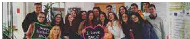
Asistentes a la Jornada

En 2019, por parte del Centro de Información Europe Direct Málaga concursó un grupo de 4 de ESO del IES José Saramago, ubicado en Humilladero con el tema “Crecimiento y Empleo en la Unión Europea”.