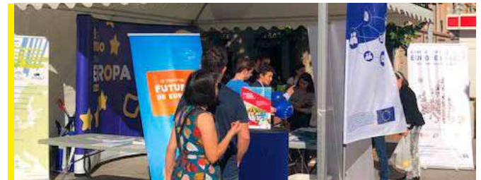
Celebración del Día de Europa en la Fuente de las Batallas

Fue celebrado en la Fuente de Batallas de Granada durante la tarde del 9 de mayo. En una carpa se desarrollaron diversas exposiciones de material y actividades para el público general. En concreto nos centramos por acercar a la población la siguiente información: se realizaron talleres infantiles, un recital de música europea y un concurso sobre el impacto de los fondos europeos en la provincia de Granada. Además, se mostró documentación y se prestó información sobre las elecciones al Parlamento Europeo, las consultas ciudadanas europeas, las posibilidades de empleo y movilidad en Europa e información general sobre otras políticas europeas.