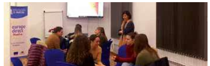
Tándem de idiomas

Teniendo en cuenta el momento en el que se han celebrado, muchas de las cuestiones han girado en torno al Brexit y la Navidad.