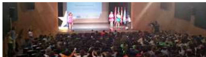
Momento del acto

El acto contó con un grupo dinamizador que fue adentrando a los asistentes en el conocimiento de los fondos estructurales, el papel de la Unión Europea en el desarrollo sostenible de los municipios, y la conservación del medio ambiente. A continuación, se representó una obra de teatro, dinámica y participativa, sobre la temática del acto y un taller de sensibilización.