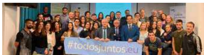
Momento debate sobre medio ambiente