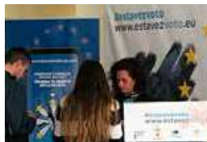
Día Europeo de las Lenguas

Ubicación de stand con material promocional con motivo del día Europeo de las lenguas y actividad didáctica con los alumnos con el objetivo de que los estudiantes, y otros ciudadanos que visitaban el stand, colocaran palabras originales para ellos en otros idiomas de la UE en un panel gigante. Finalizamos el evento con un taller sobre: "Rarezas lingüísticas », palabras que no tienen traducción, sólo tienen significado en su propia lengua. Flashmob con la participación de alumnos y profesores sobre el Día de las Lenguas.