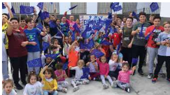
Día de Europa

Puente Genil, Cañete de las Torres, Añora, La Guijarrosa, Belmez, Iznájar, Fuente-Tójar, Adamuz, Belalcázar, Benamejí, Carcabuey, Cardeña, Conquista, Doña Mencía, Dos Torres, Fuente La Lancha, Hornachuelos, Iznájar, La Rambla, Montilla, Monturque, Obejo, Palma del Río, Pedro Abad, Posadas, Puente Genil, San Sebastián de los Ballesteros, Santa Eufemia, Valenzuela, Villa del Río, Villaharta, Villanueva del Rey, Zuheros, El Carpio, Los Blázquez, Montemayor, Córdoba, Aguilar de la Frontera, La Montaña, Montilla, Montalbán de Córdoba, Cardeña, Valsequillo, Palma del Río, Castil de Campos, Peñarroya-Pueblonuevo, Priego de Córdoba, Cabra, Fernán Núñez, Lucena, Espejo, Montoro.