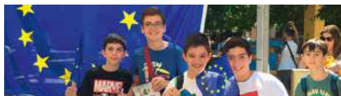
Día de Europa

ámbito educativo se contó con un stand en el que los alumnos pudieron trabajar distintos aspectos relacionados con la UE.