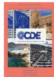
Curso de la Unión Europea