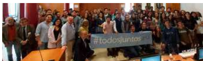
Seminario 'Hablando del Futuro de la UE en la Universidad'