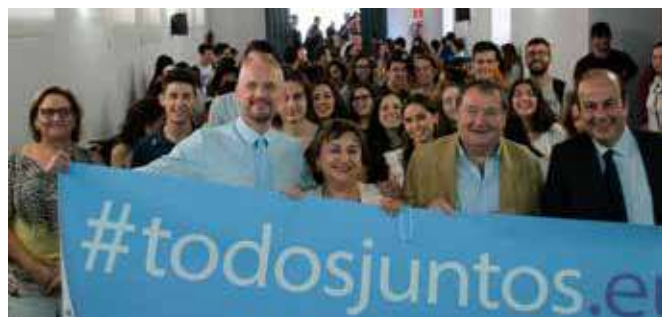
Grupo en la Jornada: “Habla del Futuro de Europa en tu Universidad”

Después continuó el debate, pero ya de forma más cercana, en el Patio Barroco de la misma facultad, donde se pudo disfrutar al mismo tiempo de un refrigerio.