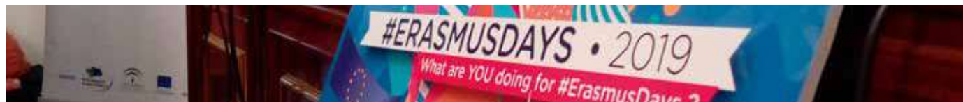
Día de Europa

Saavedra de Córdoba y en el Colegio Albolafia de Córdoba. 26 de septiembre.