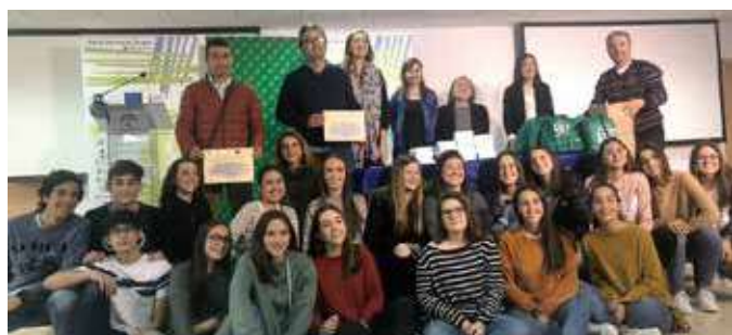
Entrega de premios

El ED Andalucía Rural llevó a cabo tres talleres informativos y de apoyo con los alumnos/as y profesores participantes.