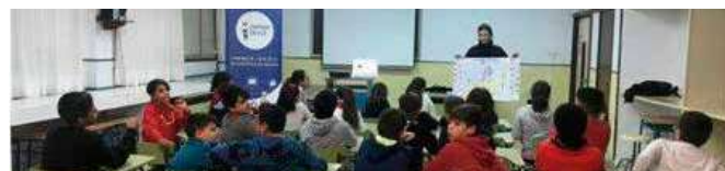
Alumnos y ponente en una de las sesiones

hitos y el funcionamiento, a la vez que se resalta la importancia que tienen en nuestro día a día las decisiones que se adoptan en el seno de la UE.