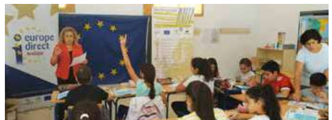
Charla sobre la importancia de la UE

y posteriormente dos dinámicas en inglés denominadas "Cada oveja con su pareja", y "Pega tu post it".