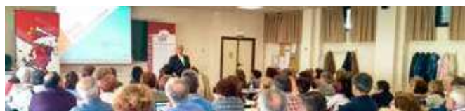
Taller Tú Eliges Tu Europa