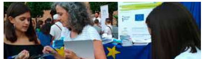
Asistentes siendo asesorados por la técnico del CDE

Como en años anteriores, y por solicitud desde el Rectorado de la Universidad de Córdoba, el Centro de Documentación Europea de Córdoba participó el día 27 de septiembre en "La noche europea de I@s investigador@s". Un año más, esta actividad tuvo lugar en los jardines del Rectorado. Dispusimos de un stand informativo con folletos sobre diferentes programas de investigación de la UE y también ofrecimos merchandising en materia europea.