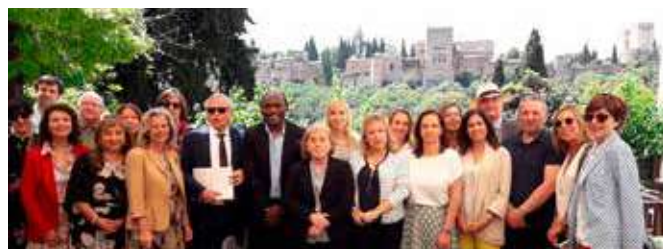
Miembros de la Red de Información Europea de Andalucía junto al premio