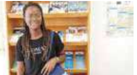
Día Europeo de las Lenguas