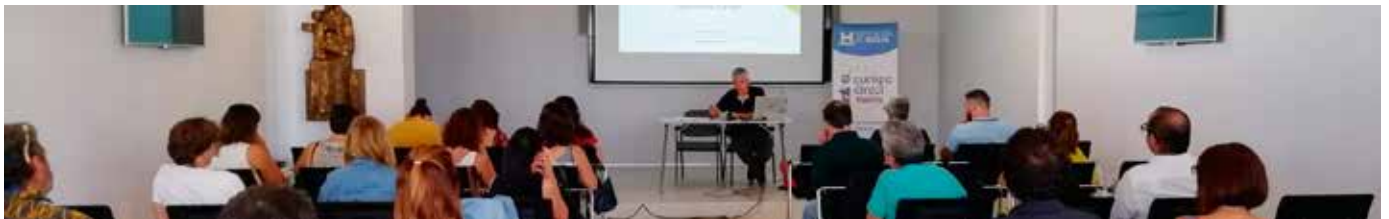
Seminario de formación

Dicho seminario estaba dirigido fundamentalmente a personal técnico de los ayuntamientos de la provincia.