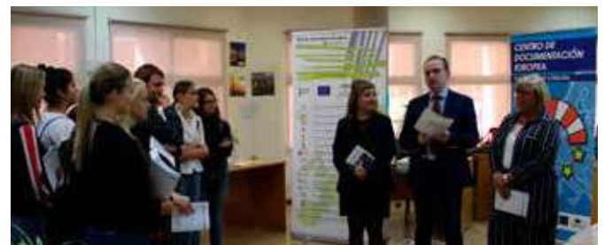
Presentación del Recital de Poesía Europea.