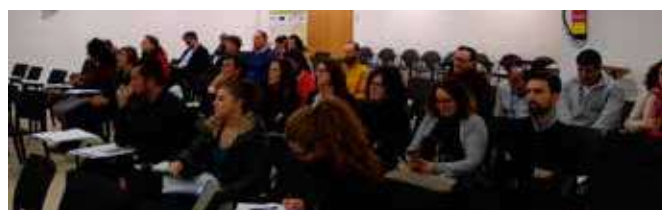
Asistentes a la Jornada

existentes para la implementación estratégica de los mismos; establecer y propiciar espacios públicos para reforzar el diálogo, el debate y la participación ciudadana activa sobre el futuro de Europa, entre otros.