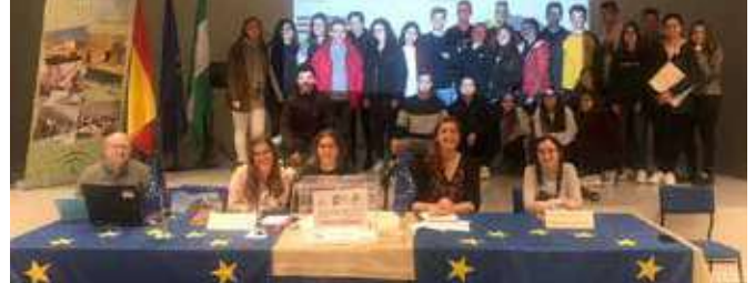
Simulación Parlamento Europeo

El 28 de junio (de 18 a 22 horas) tuvimos una sesión que sirvió como acto de clausura de esta actividad que, a propuesta de los jóvenes, tuvo el formato de una Escape Room. Para esto se seleccionó un grupo de jóvenes de entre todos los participantes en las actividades previas.