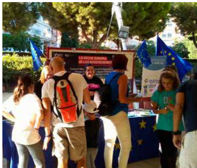
Stand del Centro de Información Europea

Además, dicho stand contó con animación de teatro y talleres, relacionados con investigación y Unión Europea.