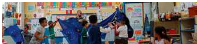
Día de Europa

El CEIP San José Obrero celebra tradicionalmente el Día de Europa y en él, el ED Sevilla organizó distintos juegos y talleres sobre los países de la UE, sus valores, sus banderas, las lenguas, etc.