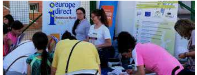
Celebración del día de Europa

Además de estas, otras actividades se han relacionado con esta celebración, como son: una simulación del Parlamento Europeo en varias escuelas secundarias; la participación de un joven de Baena en el Diálogo de Jóvenes Ciudadanos en Sibiu (Rumania, 8 de mayo) a propuesta de Europe Direct de ADEGUA, coincidiendo con la cumbre europea de Jefes de Estado y de Gobierno; taller europeo de lectura con un debate sobre una obra literaria, que incorpora una dimensión europea y la conecta con el futuro de Europa (30 de mayo).