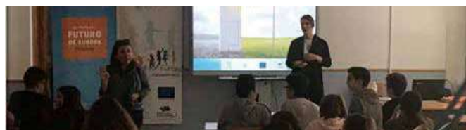
Grupo de alumnos en una de las sesiones informativas

empleabilidad, mediante la participación en las medidas y programas europeos correspondientes.