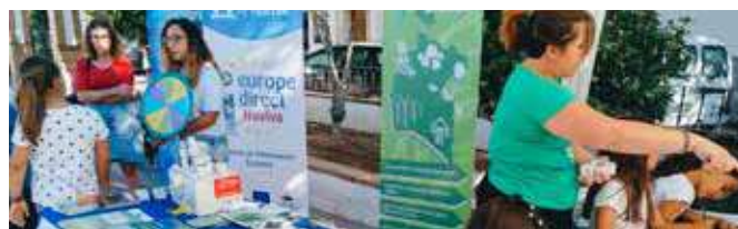
Seminario de formación

En 2019 dichos municipios han sido: El Granado, Villablanca y Villanueva de los Castillejos, donde además de la instalación del Stand informativo del centro y de la Agencia Provincial de la Energía, se ha contado con animación que ayudaba a informar de manera divertida.