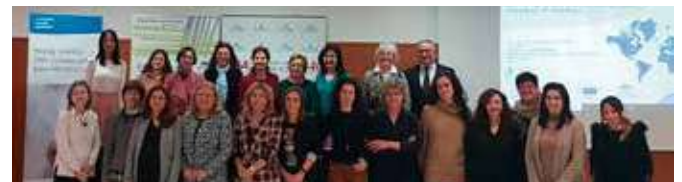
Jornada "Redes de Apoyo de la UE para Mujeres que rompen Fronteras"