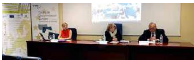
Inauguración de la Jornada de Empleo por la Jefa de Información y Formación

Centro Nacional Europass, la asesora EURES en Jaén, y la técnica encargada del Programa PICE en Granada quienes hablaron sobre el proceso de selección a las oposiciones de la UE, la elaboración del Curriculum Vitae Europass, las oportunidades de trabajo a través del portal de movilidad profesional en Europa y de las ofertas de Empleo del programa PICE gestionadas por la Cámara de Comercio. El balance de la jornada fue muy positivo y considerado de gran interés.