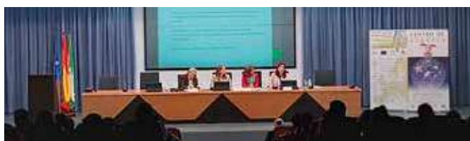
Seminario Acción Exterior