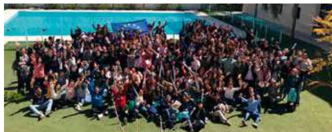
Alumnos del IES Sabinar de Roquetas de Mar

Con anterioridad al desplazamiento al CEULAJ, se les impartió un Taller de Movilidad en la Diputación de Almería.