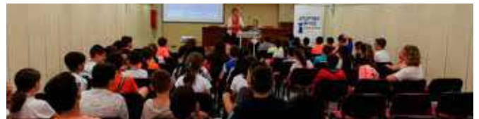
Actividades "Las lenguas y tú"

Las actividades propuestas tuvieron lugar en la Biblioteca Municipal de Castro del Río bajo el título "Las lenguas y tú. Una historia de amistad". Se llevó a cabo una presentación sobre la importancia de las lenguas y un concurso de preguntas sobre las lenguas en Europa, seguidos de un taller creativo en el que los niños imaginaron varios posibles finales para una historia en versión bilingüe sobre diversidad y convivencia.