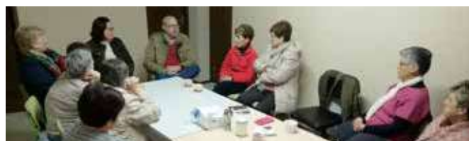
Diálogo con Asociaciones de Mujeres

Todos los participantes mostraron un gran Interés por los diferentes temas planteados, especialmente los relacionados con la agricultura, la participación ciudadana en la UE, el futuro de los jóvenes y el medio ambiente, aunque todos mostraron su pesar por el difícil acceso que tienen a la información europea.