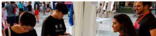
Stand en Noche Europea de los investigadores

juventud, formación y empleo en la UE y la política de investigación y desarrollo en la UE.