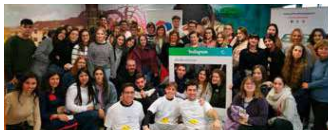
Jóvenes participantes Café con Europa en Armilla.

a través de las redes sociales del Centro Europe Direct Granada un hashtag específico del evento (#EUXMY).