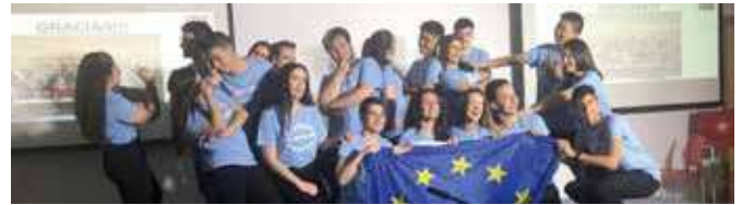
Alumnos del IES "Juan del Villar"

En esta edición, los alumnos del IES "Juan del Villar" que aportaba nuestra oficina Europe Direct Andújar, participó con una representación teatral que tenía como temática: "Europa y los ciudadanos" que consiguió el segundo puesto en el concurso escolar que tuvo lugar en Torremolinos.