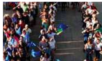
Escuela Oficial de Idiomas de San Roque