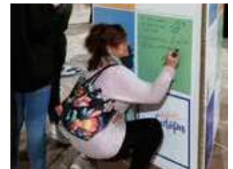
Evento “Habla de Europa”