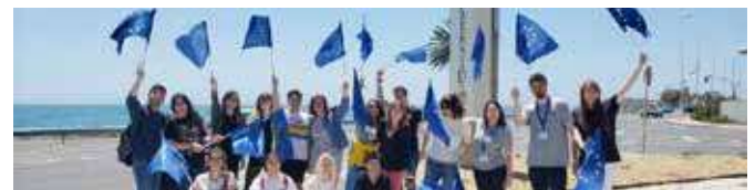
Día de Europa

Despliegue de stand en el campus de la Universidad, en el que se facilitó material informativo y documentación a toda la comunidad académica. Se realizaron, además, mini-juegos temáticos sobre la Unión Europea entre el público asistente y un sorteo de merchandising del Centro de Documentación Europea de Almería. El evento fue cubierto por Radio UAL, que realizó entrevistas a los asistentes e informó sobre los orígenes y curiosidades del Día de Europa.