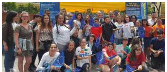
Día de Europa

Entrega de material promocional relacionado con el evento a todos los asistentes, cuestionarios y recogida de consultas sobre la Unión Europea.