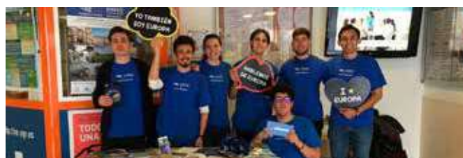
Equipo de voluntarios Mi voto Sí Importa

colaboración de un equipo de voluntarios que estuvieron presentes en todos los campus y facultades de la Universidad de Granada.