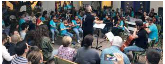
Alumnos Conservatorio Elemental de Música "Juan de Castro"

situado en la Plaza de la Constitución; además se les hizo entrega de mapas y otros obsequios.